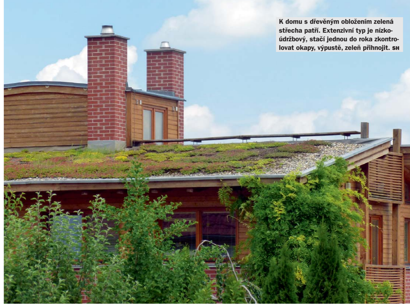
K domu s dřevěným obložení zelená střecha patří. Extenzivní typ je nízkoúdržbový, stačí jednou do roka zkontrolovat okapy, výpustě, zeleň přihnojovat. SH

● Ozelenit lze i malé plochy, které jinak vypadají fádne: třeba garážový přístřešek, střechu staré garáže, strohou střechu zahrady, vchodový přístřešek. Extenzivní nízkoúdržbová zeleň bude okrasou a může i vonět, jako např. tymián, oregano, levandule.