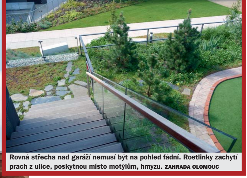
Rovná střecha nad garáží nemusí být na pohled fádni. Rostlinky zachytí prach z ulice, poskytnou místo motýlům, hmyzu. ZAHRAHA OLOMOUC

ji bude přesně tvořit, v jaké tloušťce. Důležitými vrstvami jsou: hydroizolační vrstva (speciální fólie), která slouží k zabránění pronikání vody, musí být odolná i vůči prorůstání kořínků rostlin.