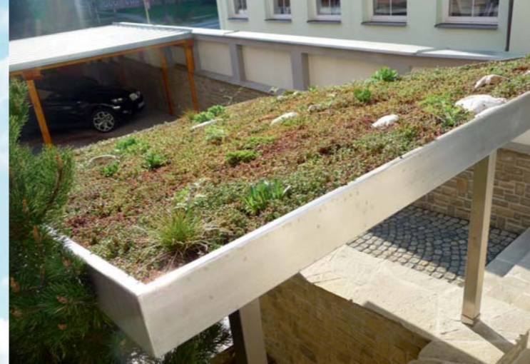
Zelené střechy mohou být i na malé ploše. Oblíbené jsou přístřešky nad garážemi či vchodem domů. ZAHRADA OLOMOUC