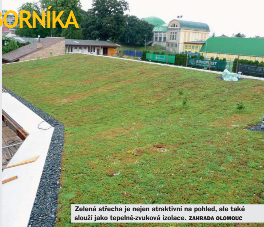
Zelená střecha je nejen atraktivní na pohled, ale také slouží jako tepelně-zvuková izolace. ZAHRAHA OLOMOUC

Důležité je si uvědomit, že střecha je extrémní stanoviště (slunce, déšť, vítr) a nelze ji vždy bezmyšlenkovitě osázet tím, co je tzv. dole na zemi. Aby vegetace na střeše rostla, volíme hlavně kvalitní odvodnění (drenáže) a za dru-