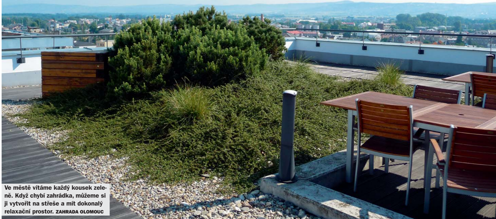
Ve městě vítáme každý kousek zeleně. Když chybí zahrádka, můžeme si ji vytvořit na střeše a mít dokonalý relaxační prostor. ZAHRADA OLOMOUC